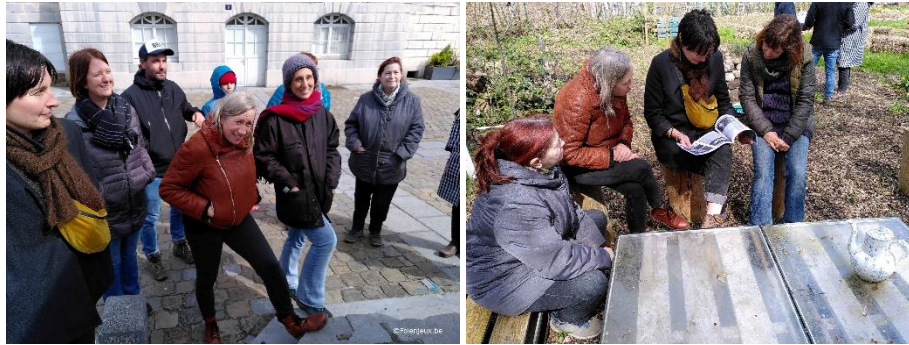
Formation à Verviers

Loin du modèle académique, les méthodes de cette formation sont fondées sur la transmission des connaissances par l'expérimentation. Chaque activité et animation sera débriefée collectivement de manière à pouvoir analyser ses tenants et aboutissants.