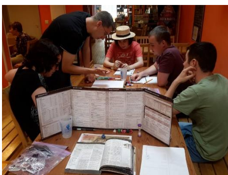
Co-animation d'une initiation au jeu de rôles