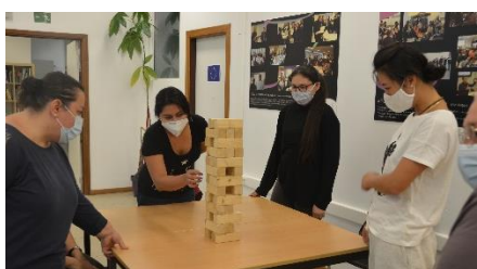
Animation jeux des tables de conversation de l'été