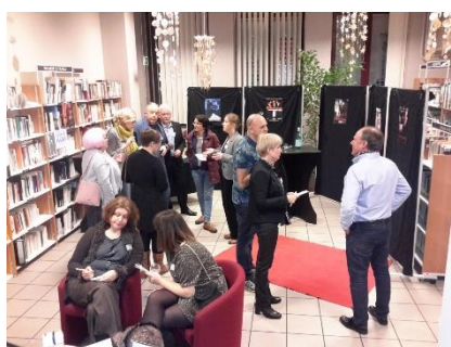
Murder party organisée à la bibliothèque de Sprimont